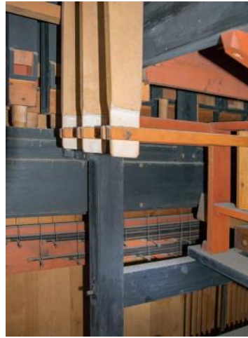
Blick auf Pedallade und drei Registerzüge des II.Man